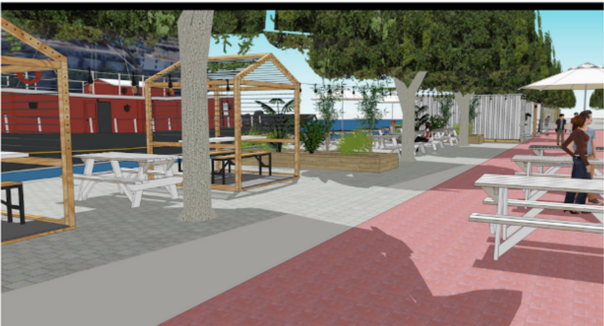
RENDUS 3D DE L'ESPACE NOUVELLE VAGUE