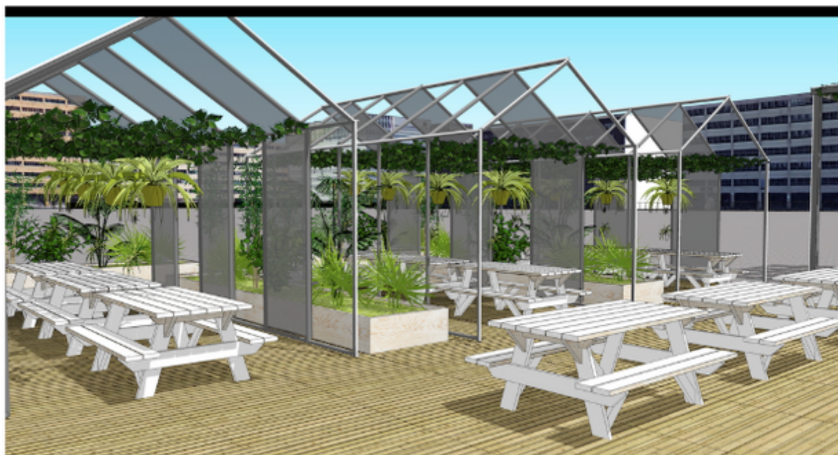
RENDUS 3D DE L'ESPACE GREEN HAÜS