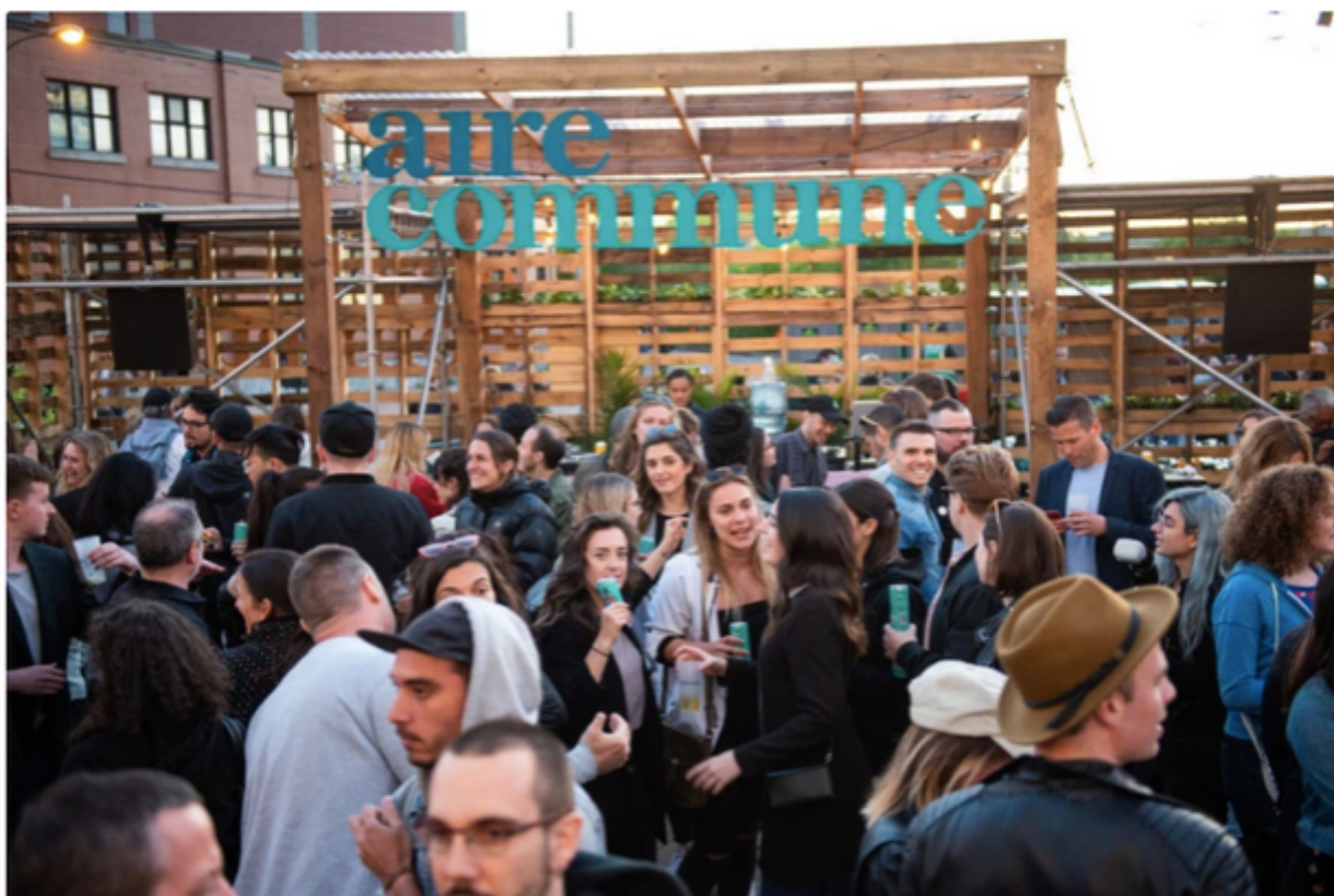
La terrasse Aire commune est ouverte jusqu'au 27 septembre.